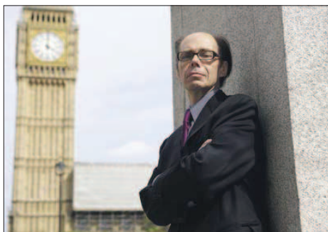
Jeffery Deaver, autor de 'Carta blanca'.